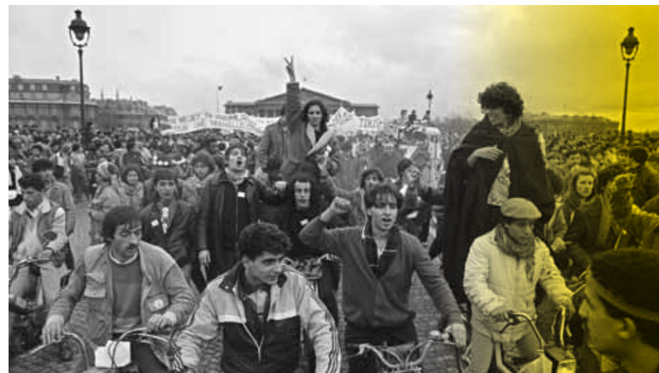
Marche pour l'égalité et contre le racisme, 1983

Projection suivie d'une rencontre avec Éric Deroo .