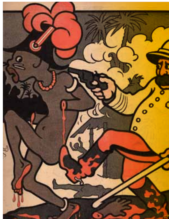
Caricature de Jossot