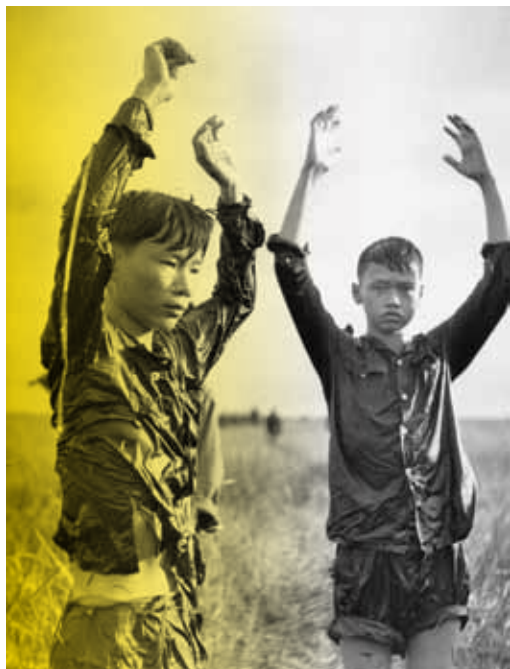
L'Empire du milieu du sud

Première pièce de l'auteur suédois d'origine tunisienne Jonas Khemiri, Invasion ! parle avec beaucoup de finesse et un humour grinçant d'identité, du racisme et de la peur de l'autre. Sur fond d'autobiographie, elle pointe les glissements sémantiques qui, peu à peu, stigmatisent les différences et cristallisent le fantôme de l'étranger « dangereux ». Dans le cadre des Ateliers de lecture contemporaine, les élèves en art dramatique du Conservatoire de Poitiers proposent une lecture de cette pièce suivie d'une rencontre avec Marianne Ségol-Samoy, traductrice, qui permettra l'exploration littéraire et dramatique de l'œuvre de Jonas Khemiri.