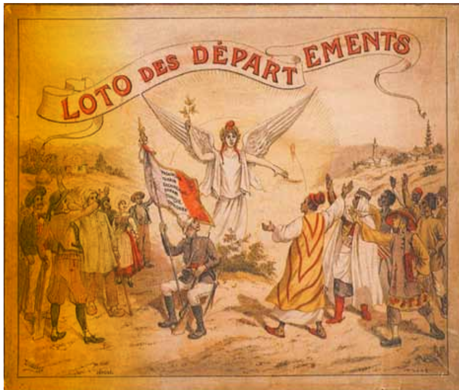
Couvercle du Loto des départements « Au paradis des enfants »