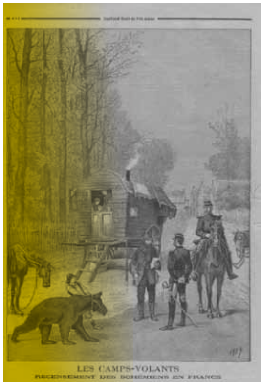
table ronde / 10h30 TAP auditorium – durée : 1h30 LES BOHÉMIENS, LES ROMS ET LES GENS DU VOYAGE : HISTOIRE ET ACTUALITÉ